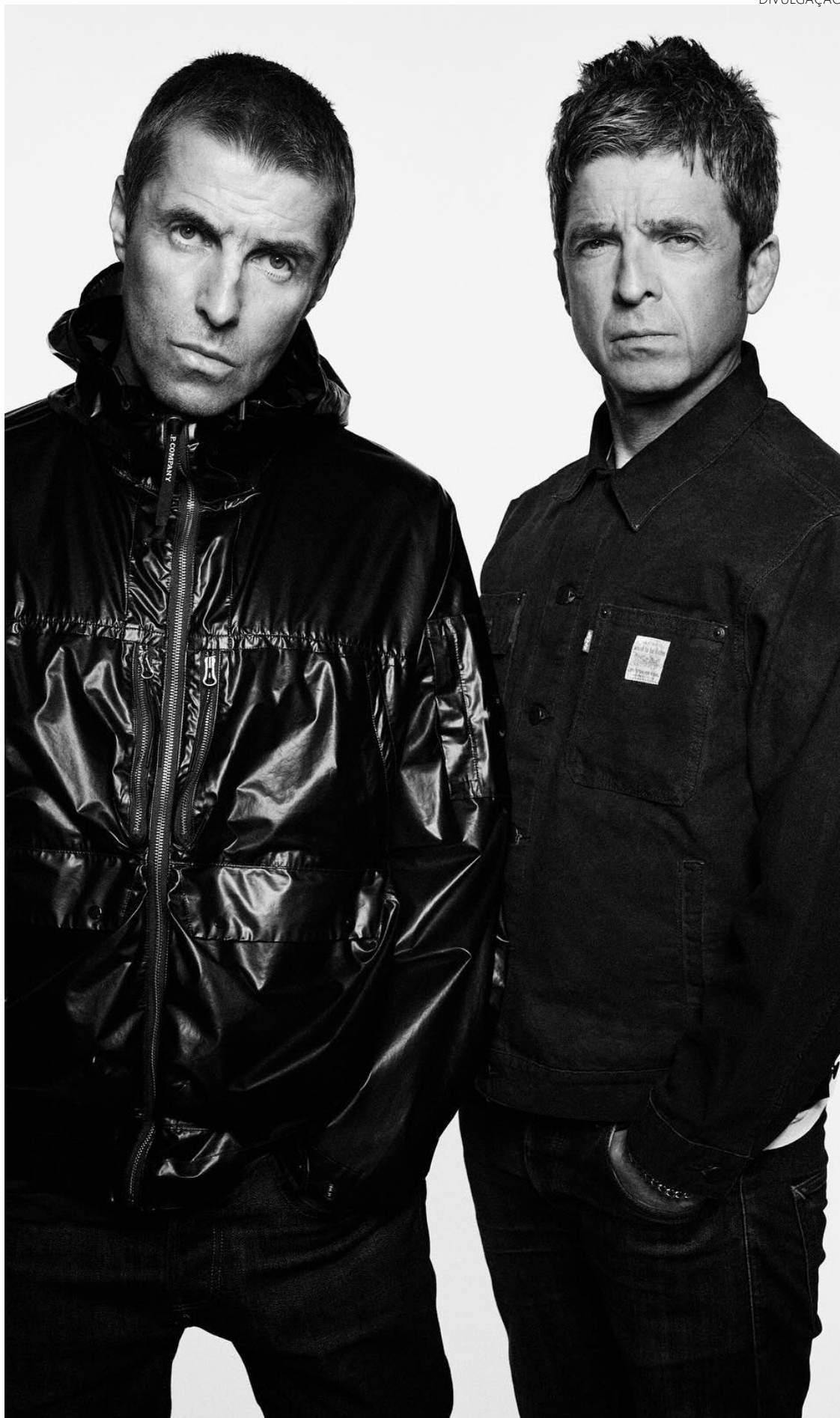
Liam e Noel Gallagher vão excursionar pela primeira vez desde fim da banda, em 2009

A história do Oasis se inicia em 91, com Noel trabalhando como técnico de guitarra para