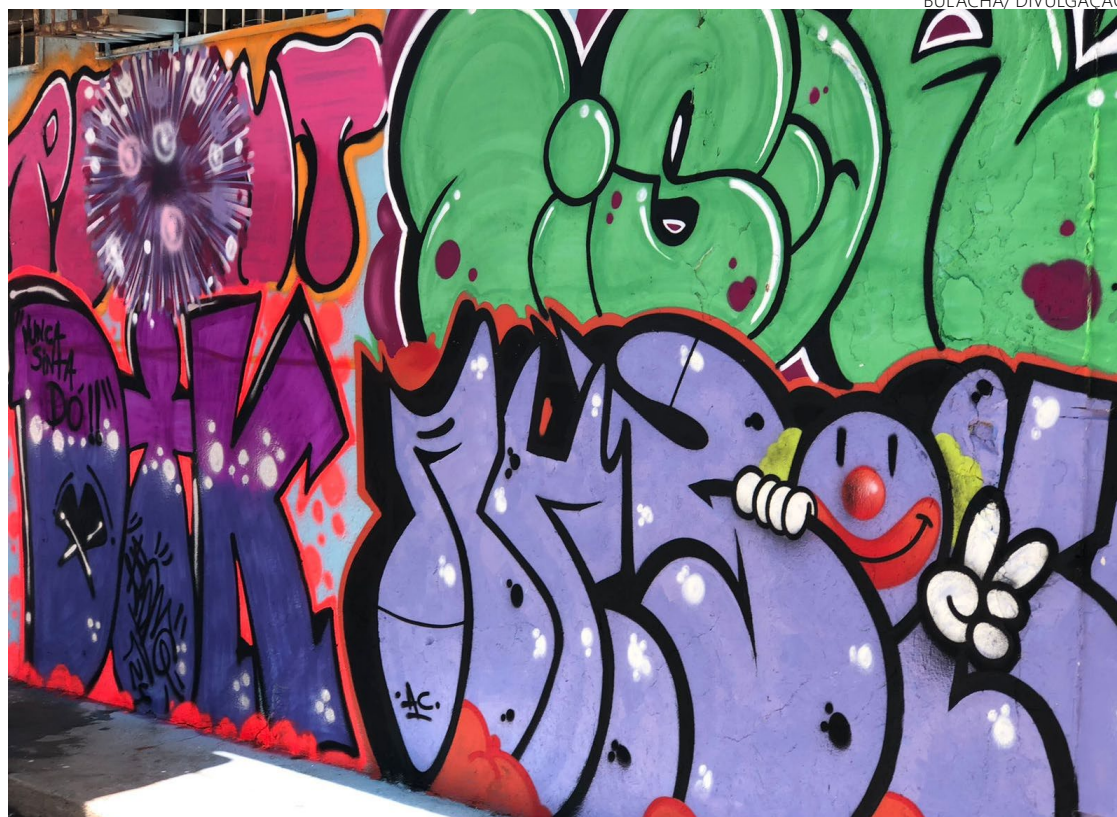
Galeria democrática: mais de 150 artistas emprestaram novas formas ao espaço

O EGMC oferecerá uma programação diversificada, incluindo apresentações circenses, oficinas de malabares, rodas de conversa e intervenções artísticas. A programação completa pode ser conferida no local do evento e nas redes sociais, prometendo diversão