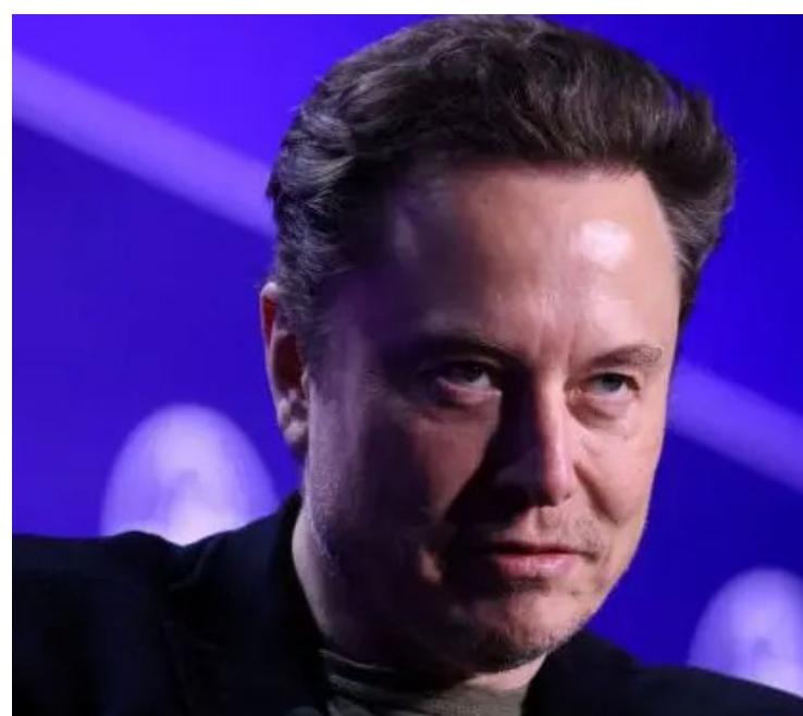
Empresário Elon Musk

Em sua conta, Musk disse que a “decisão de fechar o escritório X no Brasil foi difícil”. “Se tivéssemos concordado com as exigências de censura secreta (ilegal) e entrega de informações privadas de @alexandre, não haveria como explicar nossas ações sem ficarmos envergonhados.” “Não há dúvidas de que Moraes precisa sair. Ter um ‘justiciero’ que viola a lei repetidamente e flagrantemente não é justiça nenhuma”, afirmou em outra postagem.