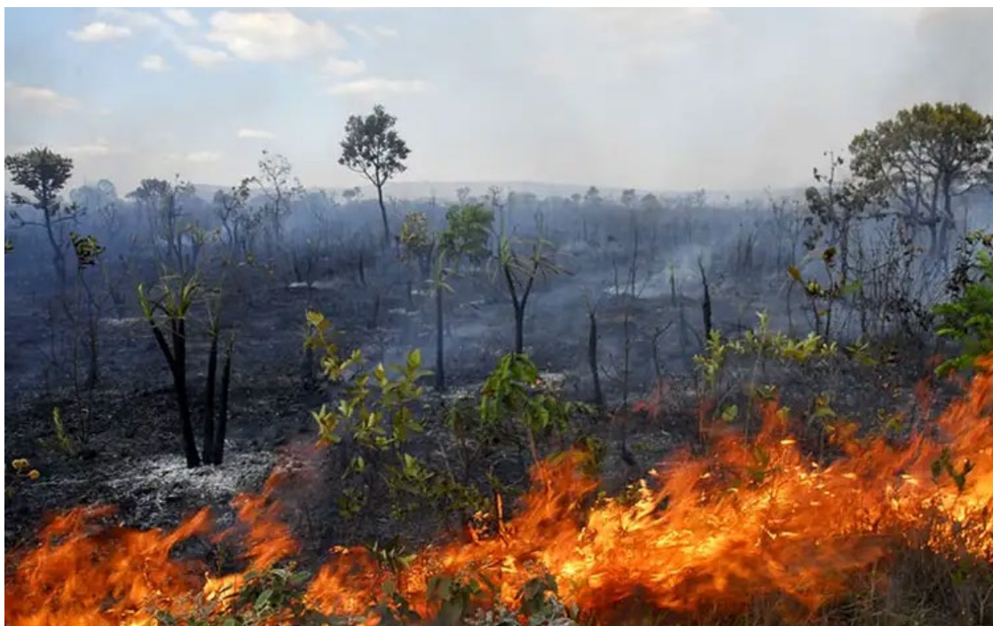
Frente Parlamentar da Agropecuária reforçou compromisso contra as queimadas

Governadores que compõem o Consórcio Brasil Central se manifestaram contra o desmatamento e as queimadas que assustam o país; acordo para combater danos foi feito durante abertura da Feira Internacional do Comércio Exterior (Ficomex)