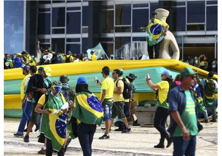
Atos na Praça dos Três Poderes, em Brasília: punição aos golpista