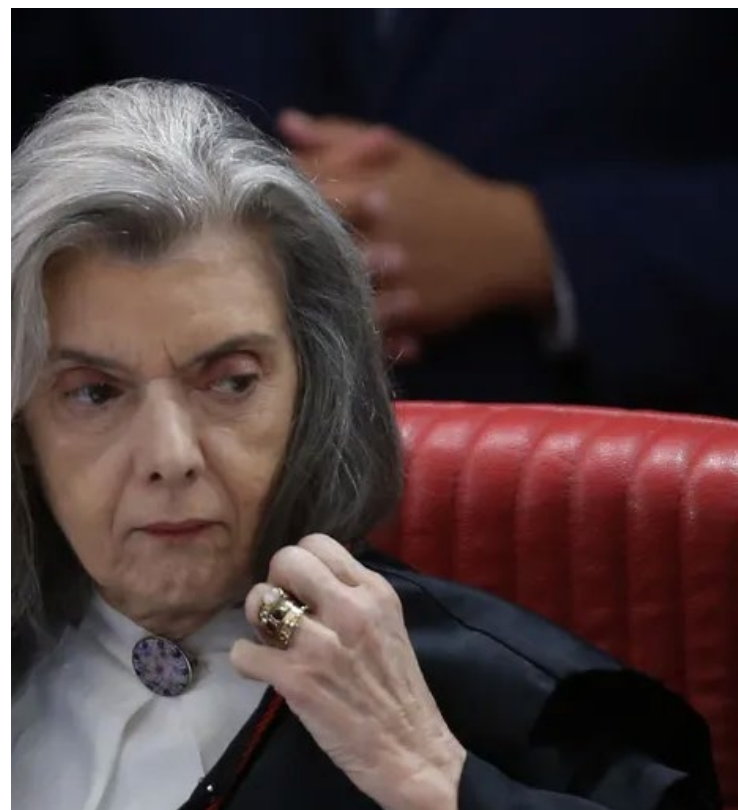
Cármem Lúcia: propaganda eleitoral permite interação de candidato e eleitor