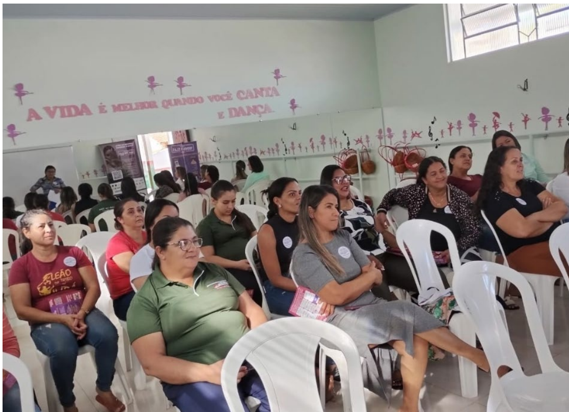
Capacitação é uma das estratégias para redução dos índices de violência contra as mulheres

A luta pela defesa dos direitos das mulheres e também proteção contra atos violentos teve início em Goiás no início da década de 1980, com a criação do Centro de Valorização das Mulheres (Cevam). Criada pela advogada e jornalista